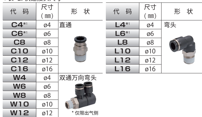
●表 -2. 快速接头尺寸