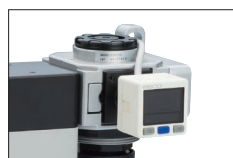
双画面 带电子显示器 压力表