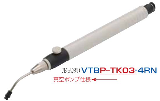
形式例) VTBP-TK03-4RN 真空ポンプ仕様 ←

真空破壊機能 真空破壊機能を目的として、内部に \phi 0.3\text{mm} のオリフィスを持たせています。よって吸着時に大気吸入しています。